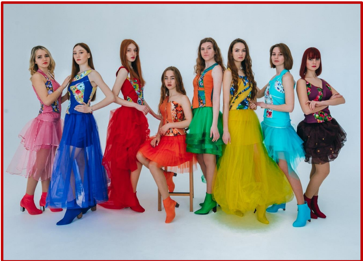
Колекція «Кольорове сяйво»