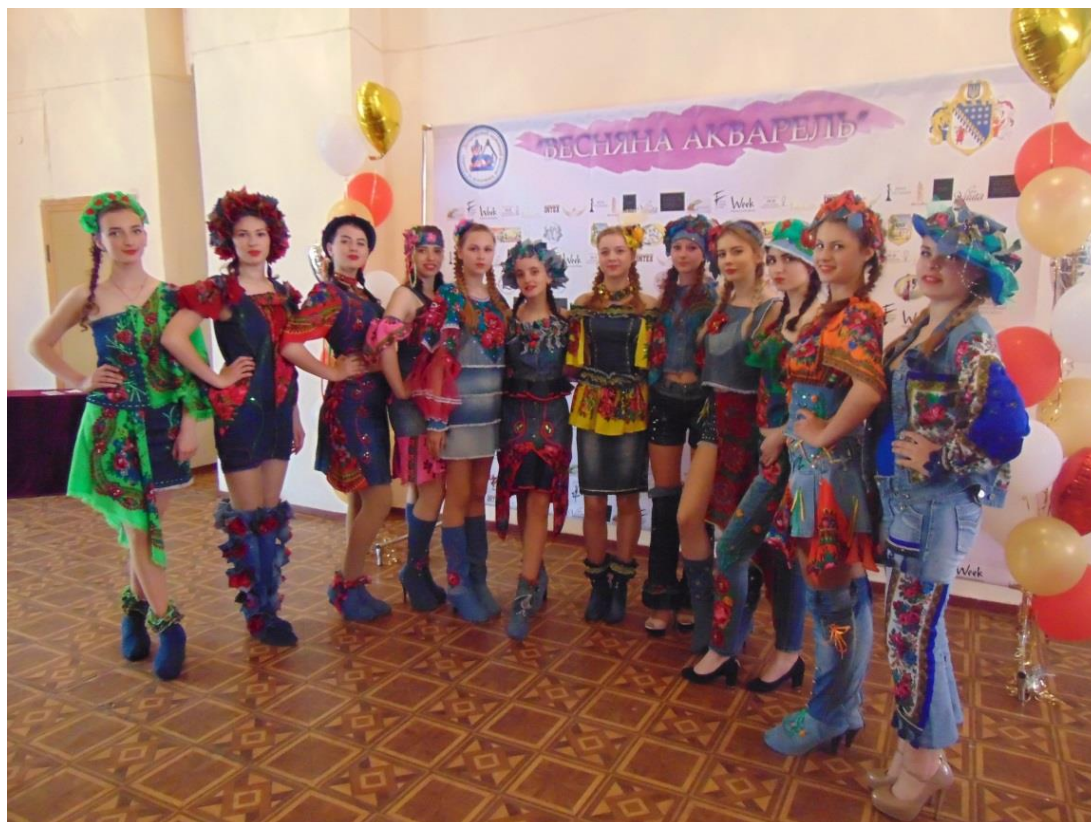
Молодіжний фестиваль моди «Весняна акварель» м.Дніпро