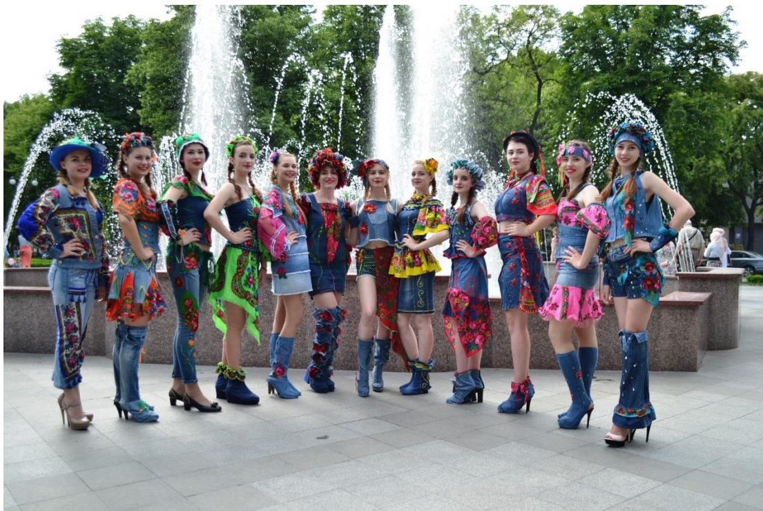
Колекція «Джинсовий мікс»