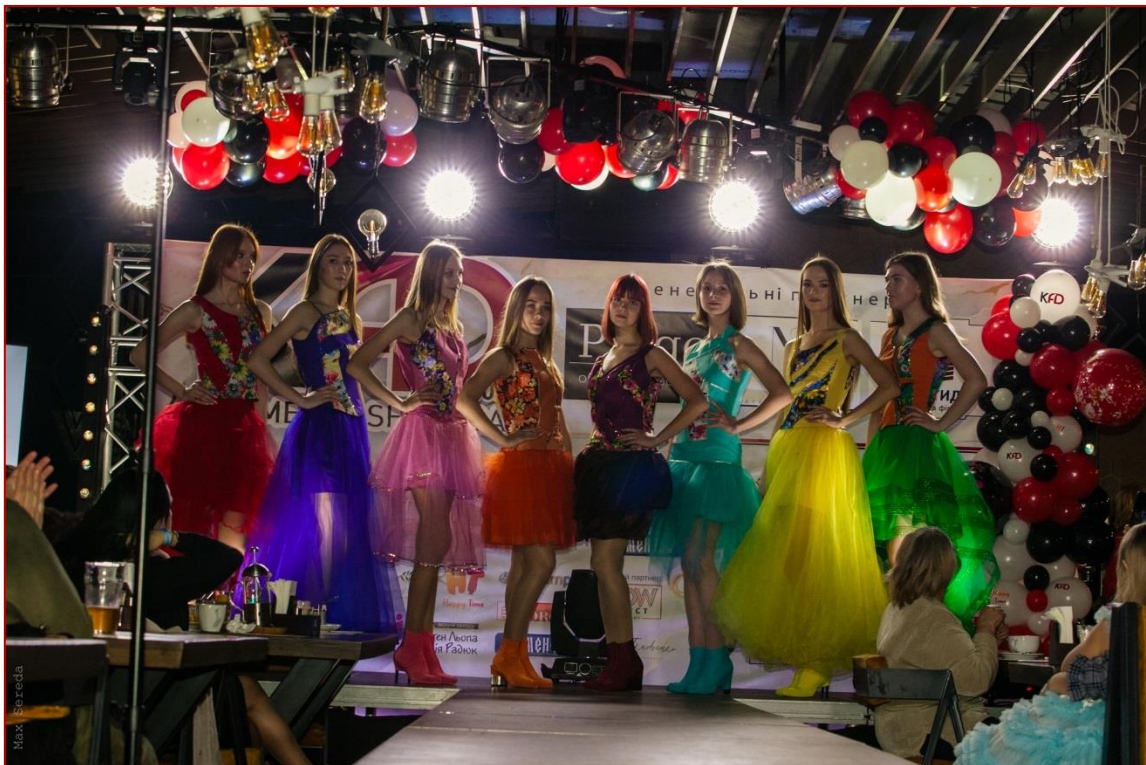
Участь у міському проєкті «Kremen Fashion day».